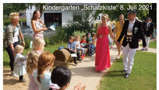
Kindergarten „Schatzkiste“ 8. Juli 2021