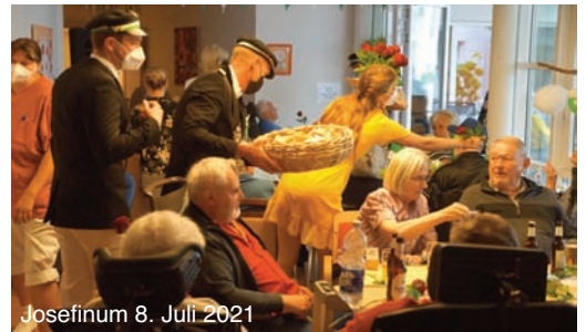
Josefinum 8. Juli 2021