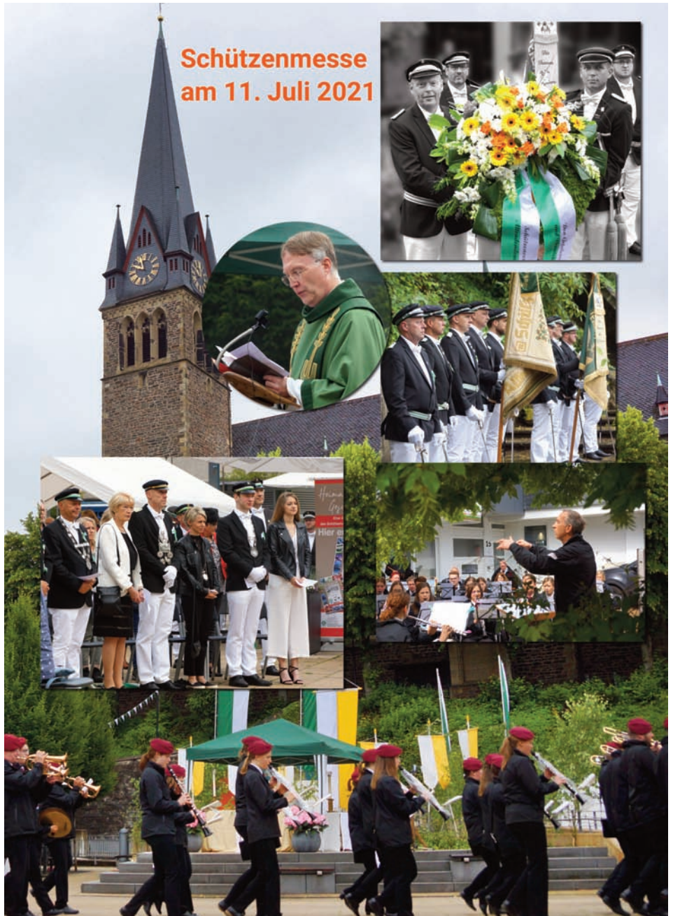
Schützenmesse am 11. Juli 2021