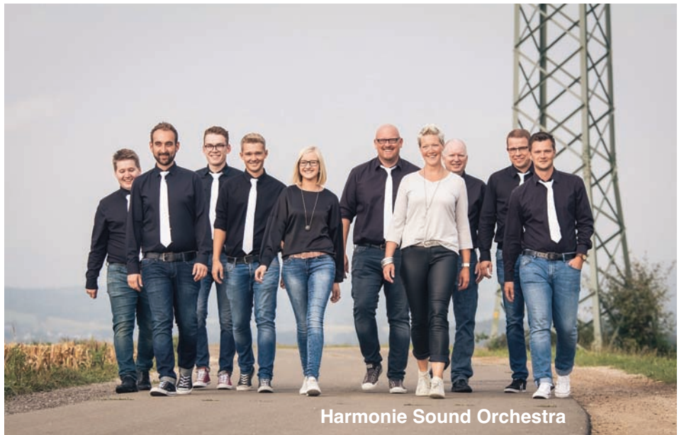
Harmonie Sound Orchestra

Captain-America-March Bohemian Rhapsody September aus Earth, Wind & Fire 80er Kult(tour) Seeadler-Marsch (Änderungen vorbehalten)