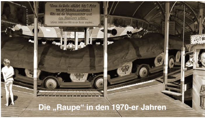
Die „Raupenbahn“ in den 1970-er Jahren

Der Kirmesplatz ist mit seinen Fahrgeschäften seit jeher Spielplatz für Kinder jeden Alters. Für Teenager zudem eine der Möglichkeiten, dem anderen Geschlecht näher zu kommen. Ob Autoscooter oder die rasanten Rundfahrgeschäfte, „man kam sich näher“. Besonders die Raupenbahn mit ihrem Faltdach war Dreh- und Angelpunkt vieler Konflikte mit Kirche und Behörden. Die Fliehkräfte, die während der Fahrt entstehen, trieben die innen sitzende Person unweigerlich in die Arme der am Rande sitzenden Person. Ein sich näher Kommen während der Fahrt war also unvermeidlich. In Amerika hießen diese „Höllenfahrten“ auch „White-knuckle-rides“, weil die Mädels krampfhaft versuchten, sich am Haltebügel festzuklammern. Viele Ämter sahen sich, noch in den 1950er Jahren, genötigt, die Fahrt mit geschlossenem Faltdach zu verbieten oder zeitlich zu beschränken. 15 Sekunden galten demnach noch als schicklich. Eine Polizeistation in Niedersachsen hat diese Empfehlung ausgesprochen. „Es ist davon auszugehen, dass ein Sittenstrolch etwa 25 Sekunden braucht, um den BH einer Mitfahrerin zu öffnen“. Das waren noch Zeiten!